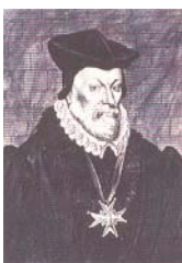
François de Foix Candale

Der Anstieg der Nebenkosten des Besitzes veranlassten ihn einen Partner für neue Investitionen zu suchen. 1984 übernimmt die Gruppe GMF einen kleinen Anteil am Kapital der Gesellschaft und kauft 1986, nach dem Tode von Aymar Achille-Fould 89 %.