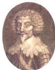
Jean-Louis de Nogaret de la Valette Premier Duc d'Epernon