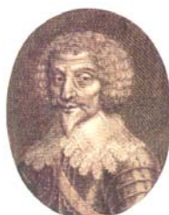
Jean-Louis de Nogaret de la Valette Premier Duc d'Epemon